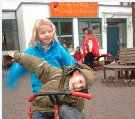
Action vor dem firmeneigenen Kinderhaus!