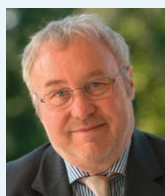
Dr. Rainer Prewo MdB Wirtschaftspolitischer Sprecher rainer.prewo@ spd.landtag-bw.de

Stattdessen deinvestieren wir – bauen Qualität ab, verzehren Landesvermögen und sorgen obendrein für eine große Auftragslücke der mittelständischen Bauindustrie, die den Tiefbau im Land trägt.