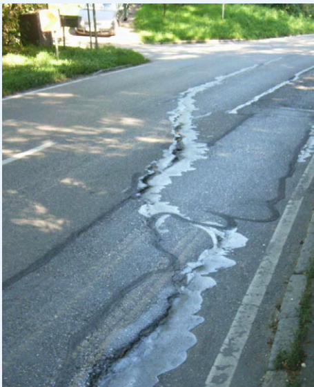
Landesweit ein immer häufigeres Bild.

Warum kommt das Land bei Bau und Erhalt von Verkehrswegen nicht voran?